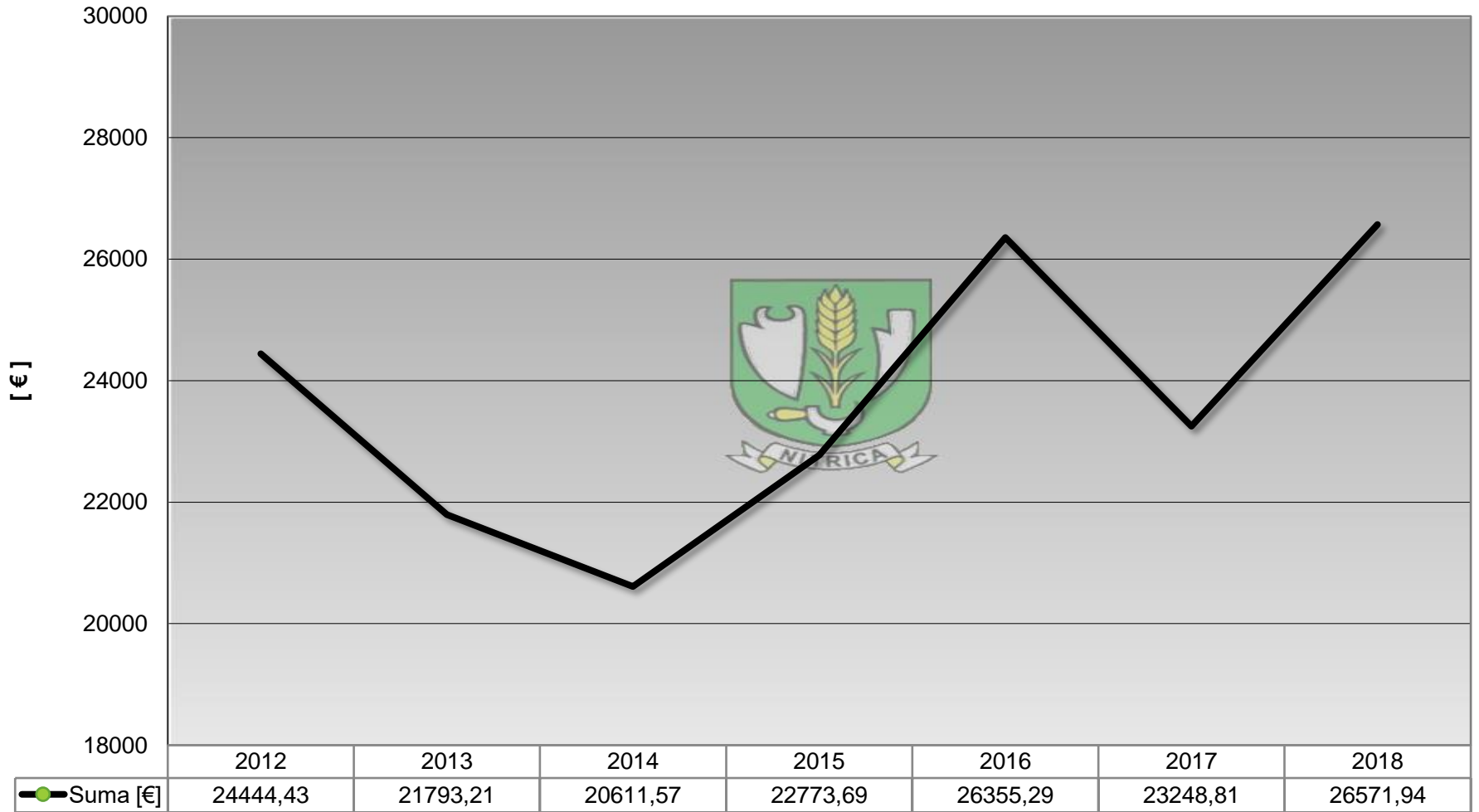
Spolu náklady na likvidáciu odpadu v [ € ]